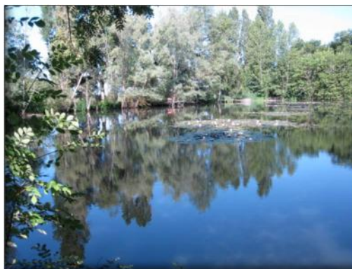
L'Étang de pêche