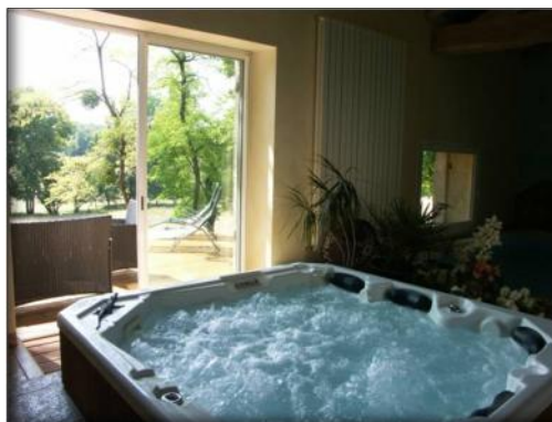
Jacuzzi avec vue sur la campagne