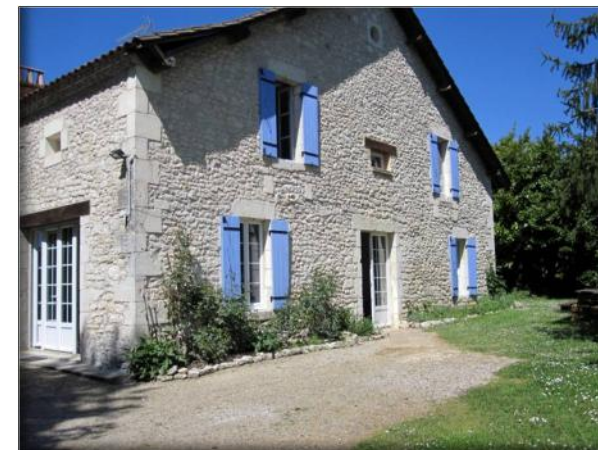
« La Métairie » *** : Maison de plus de 200 M 2 4 chambres - Capacité : 8 personnes

La Shertane dispose de deux gîtes de caractère tout confort :