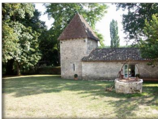
Vue de face du bâtiment (accès principal)

Bâtiment indépendant sur la propriété de plus de 70 M2, cet espace de détente privatif propose un jacuzzi professionnel, un hammam et une petite piscine intérieure (non chauffée pour utiliser avec le Hammam). Espace tout confort, vous y trouverez également une douche, un WC et une grande terrasse de 30 M2 donnant sur la campagne.