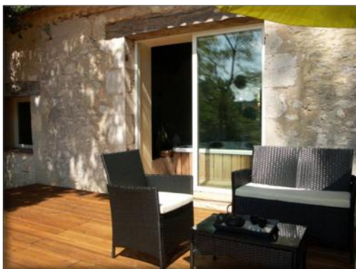
Terrasse donnant sur la campagne (ouverte de juin à septembre)