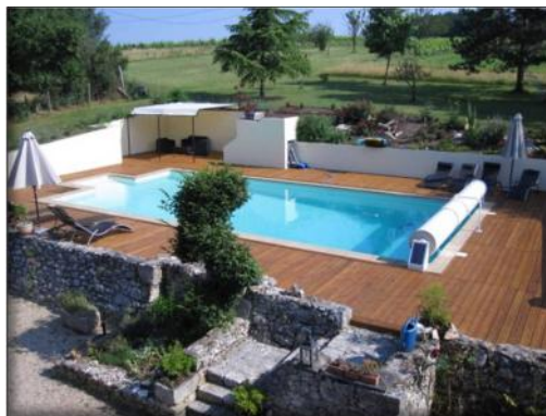
La piscine extérieure (12x6m)