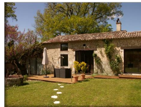
« L'Armandine » **** : Appartement de 75 M 2 1 chambre - Capacité : 2 personnes