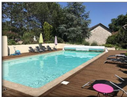
La piscine extérieure